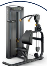
ウエスト引き締め