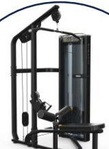
引き締まった背中